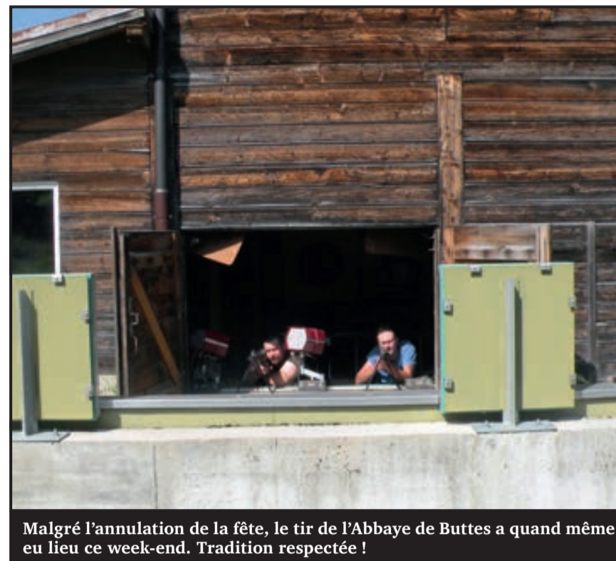
Malgré l'annulation de la fête, le tir de l'Abbaye de Buttes a quand même eu lieu ce week-end. Tradition respectée !

À Buttes, certaines traditions ont le cuir épais. Malgré l'annulation de l'Abbaye de Buttes – faute de bénévoles suffisants –, le tir a bel et bien eu lieu le week-end dernier. La société de tir de La Butterane a tenu à le maintenir. C'est un beau symbole qui a été respecté puisque cette fête était à la base « juste » une fête de tir. On est revenu à l'origine de l'Abbaye de Buttes si on veut bien (et si on veut voir les choses du bon côté surtout). Voici donc le palmarès de cette année.