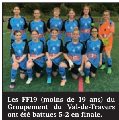
Les FF19 (moins de 19 ans) du Groupement du Val-de-Travers ont été battues 5-2 en finale.

Les filles du Groupement du Val-de-Travers étaient à l'honneur puisque les moins de 15 ans (FF15) et les moins de 19 ans (FF19) étaient en finale dans leur catégorie respective. Les FF15 ont été les plus proches de la coupe mais elles se sont malheureusement inclinées aux tirs au but contre Audax-Friul (7-6). Le score était de 0-0 après le temps réglementaire. Les FF19 rencontraient aussi Audax-Friul et elles ont aussi perdu leur duel. Réduites à dix joueuses en seconde mi-temps, elles n'ont pas réussi à aller chercher l'exploit (défaite 5-2).