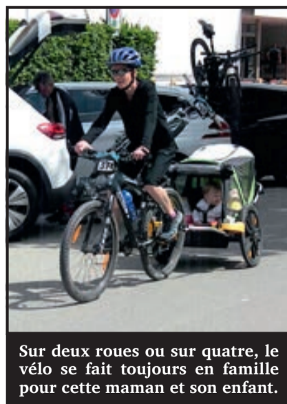
Sur deux roues ou sur quatre, le vélo se fait toujours en famille pour cette maman et son enfant.

Difficile quand même d'arriver à la même cote de popularité. « Les premiers arrivés nous ont déjà demandé s'il était possible d'avoir une portion de soupe aux pois une heure avant midi. Il faut croire qu'elle est attendue », rigole-t-il. Lundi, les organisateurs ont enfin pu se détendre un peu après quelques jours d'angoisse. « On a vu les orages se succéder avec inquiétude tout au long du week-end. On est content d'avoir eu cette fenêtre de beau pour Pentecôte. Les parcours étaient boueux par endroits mais ça fait partie du jeu. »