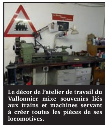
Le décor de l'atelier de travail du Vallonnier mixe souvenirs liés aux trains et machines servant à créer toutes les pièces de ses locomotives.

Celui qui habite à la rue de la Gare à Couvet, ça ne s'invente pas, s'applique à construire sa nouvelle