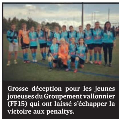
Grosse déception pour les jeunes joueuses du Groupement vallonnien (FF15) qui ont laissé s'échapper la victoire aux penaltys.