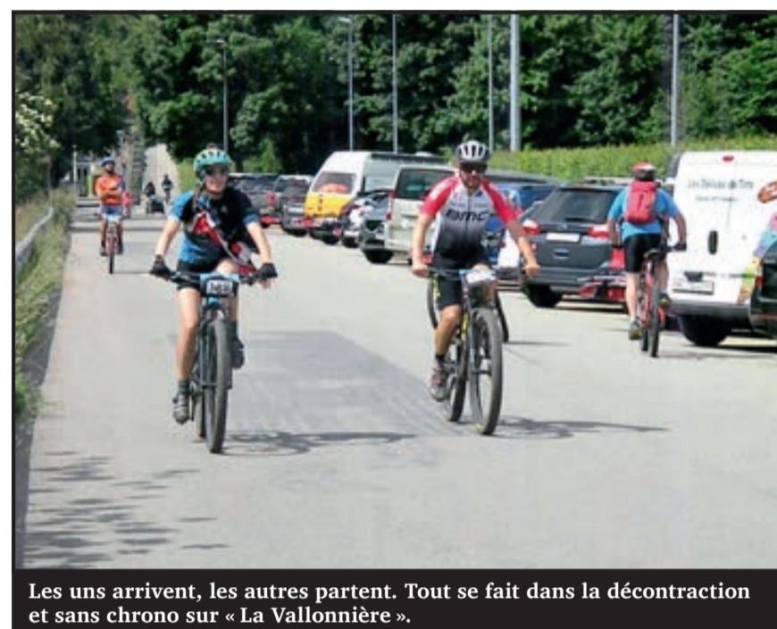
Les uns arrivent, les autres partent. Tout se fait dans la décontraction et sans chrono sur « La Vallonnaire ».

Une place de nettoyage avait été mise en place pour permettre aux 450 participants de faire « bécane neuve » avant de recharger les vélos. Seul petit problème, une partie des flèches de balisage (au sol) ont été effacées par la pluie et il a fallu ressortir les bombes de peinture lundi matin. « Comme il est de coutume, j'ai balisé les par-