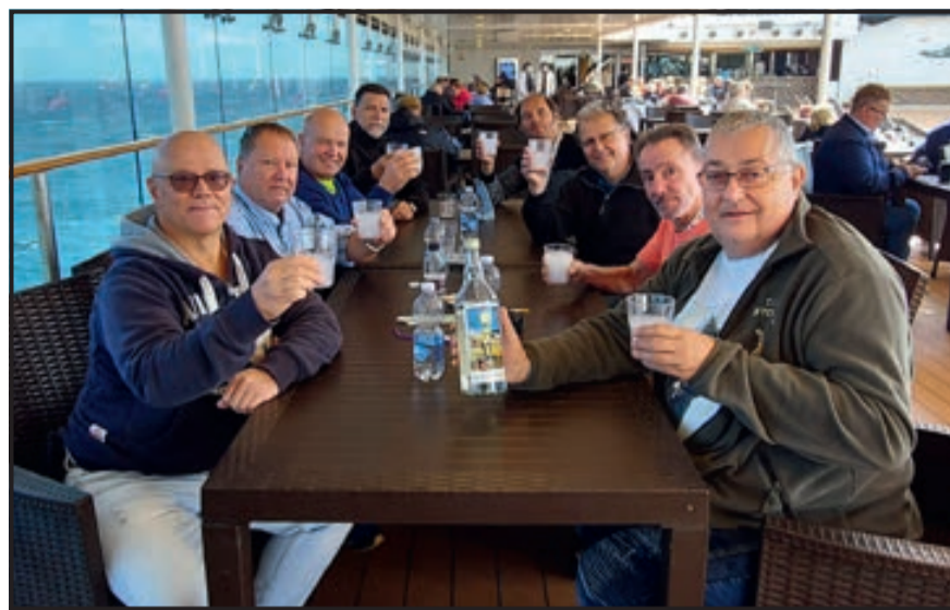
Les contemporains de 1962 se sont retrouvés, fin mai, lors d'une croisière en Norvège, afin de célébrer ensemble leur 60 e anniversaire ! La fée verte a bien évidemment été invitée pour cette occasion spéciale...