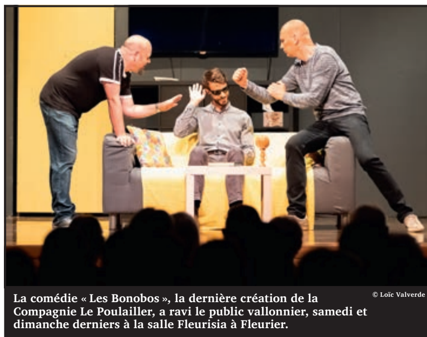
La comédie « Les Bonobos », la dernière création de la Compagnie Le Poulailleur, a ravi le public vallois, samedi et dimanche derniers à la salle Fleurisia à Fleurier.