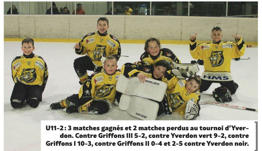
U11-2: 3 matches gagnés et 2 matches perdus au tournoi d'Yverdon. Contre Griffons III 5-2, contre Yverdon vert 9-2, contre Griffons I 10-3, contre Griffons II 0-4 et 2-5 contre Yverdon noir.