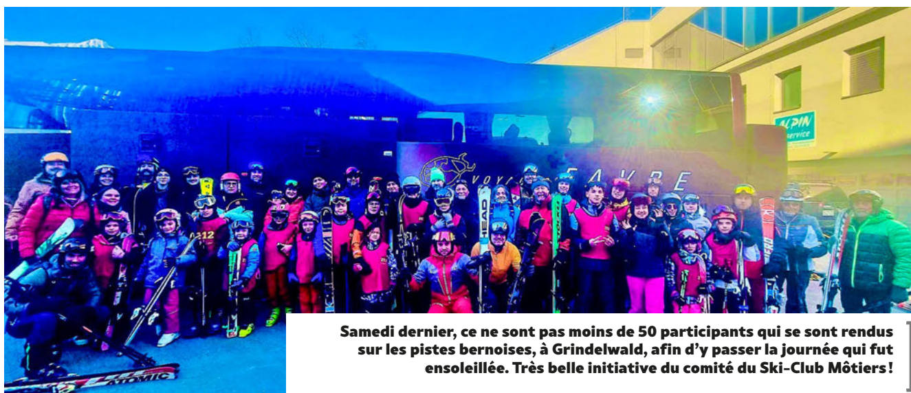
Samedi dernier, ce ne sont pas moins de 50 participants qui se sont rendus sur les pistes bernoises, à Grindelwald, afin d'y passer la journée qui fut ensoleillée. Très belle initiative du comité du Ski-Club Môtiers !