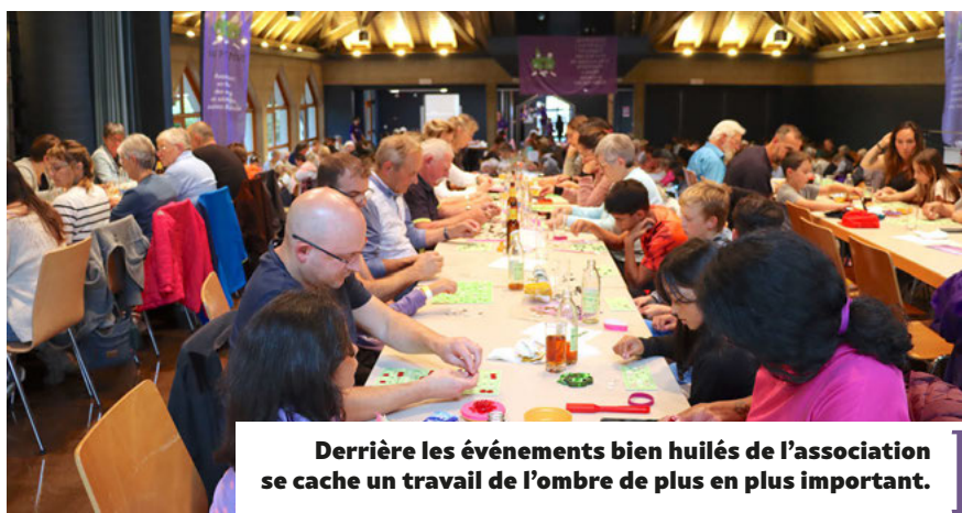
Derrière les événements bien huilés de l'association se cache un travail de l'ombre de plus en plus important.

Pour mieux vous planter le décor de l'importance des actions d'Un P'tit Plus, un seul chiffre suffit : 250'000 ! C'est en francs, le montant versé par l'association aux familles des enfants victimes de cancer depuis 2003. Vous voulez que je sois encore plus clair ? Alors voici un second chiffre : 100'000 ! C'est toujours en francs et cela correspond à l'aide versée lors des deux dernières