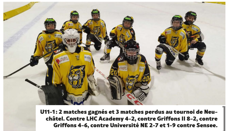
U11-1: 2 matches gagnés et 3 matches perdus au tournoi de Neuchâtel. Contre LHC Academy 4-2, contre Griffons II 8-2, contre Griffons 4-6, contre Université NE 2-7 et 1-9 contre Sensee.